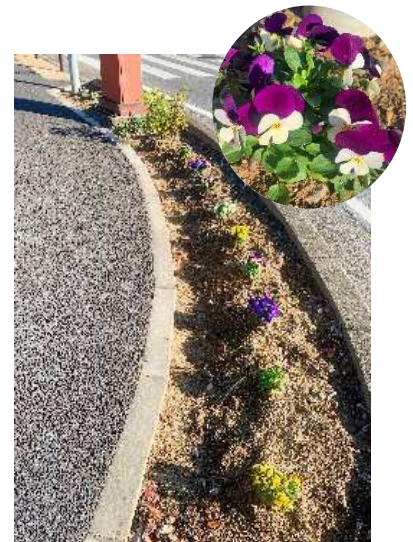
あすみが丘プラザ交差点の花壇

覧下さい。)私があすみが丘に引っ越してきた理由の一つが町の美しさでした。当初は、開発には定評のある「東急」が手掛けた町は、さすがに手入れも行き届き、なんて美しいのだろうと思ったものです。しかし最近、以前よりゆっくり散歩をするようになると、その美しさは、実はそこに住む方々の日々の積み重ねの賜物であるなあと感じます。毎日、自分の家の敷地以外の場所を掃いたり、落ち葉の季節は朝に夕にと枯葉との格闘、「緑道脇の出窓は早めに灯りを点けるのよ。」とおっしゃる方もいます。また暑い夏も寒い冬も道路脇に花を植えお世話をして下さる方(右の写真)、他のワンちゃんの困った忘れ物を拾う方々もいます。古き良き時代を再利用の創造性で繋げてきたヨーロッパ建築の街並みとまでは行かないけれど、アンティークの家具や食器のように、人の手と心が加わった温かい趣きのある美しさに出会えることに感謝するこの頃です。 S・H